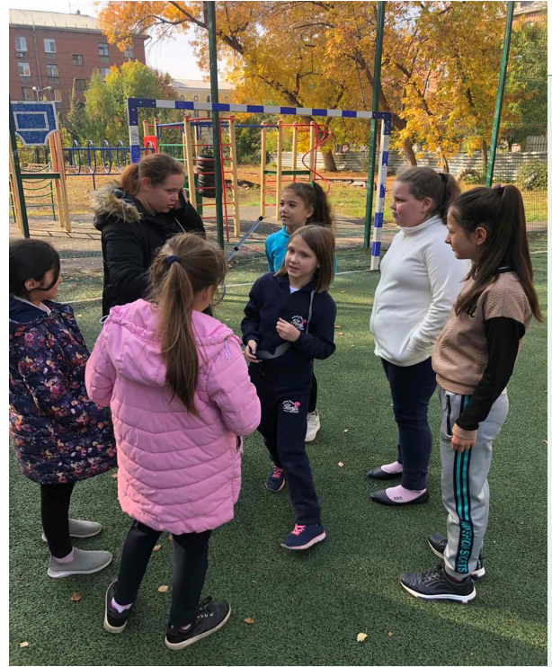
«На спортивной площадке школы, совместно с СГОО «Контур», прошло спортивное мероприятие «Знакомство с лесным спортом» в целях ознакомления со спортивным ориентированием.»