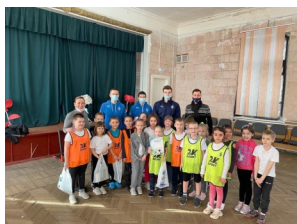
Школа футбола «Лайк».

Детская музыкальная школа №9 им. Г.В.Беляева;